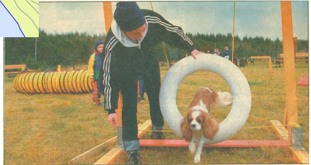
Hundar að leika í Öskjuhlíðinni

Allt frá því elstu menn muna hefur verið hægt að fara með litla krakka út á „róló“ í Reykjavík, eins og leikvöllir voru kallaðir áður fyrr. Njásti leikvöllurinn í Reykjavík er þó ekki ætlaður krökkum heldur hundum, en í gær var tekið í notkun sérstakt og afgirt svæði fyrir hunda vestan við Öskjuhlíð þar sem hægt er að sleppa hundum sem fólk er með á göngu og leyfa þeim að leika sér, meðal annars með því að stökkva í gegnum dekk eins og sjá má á myndinni.