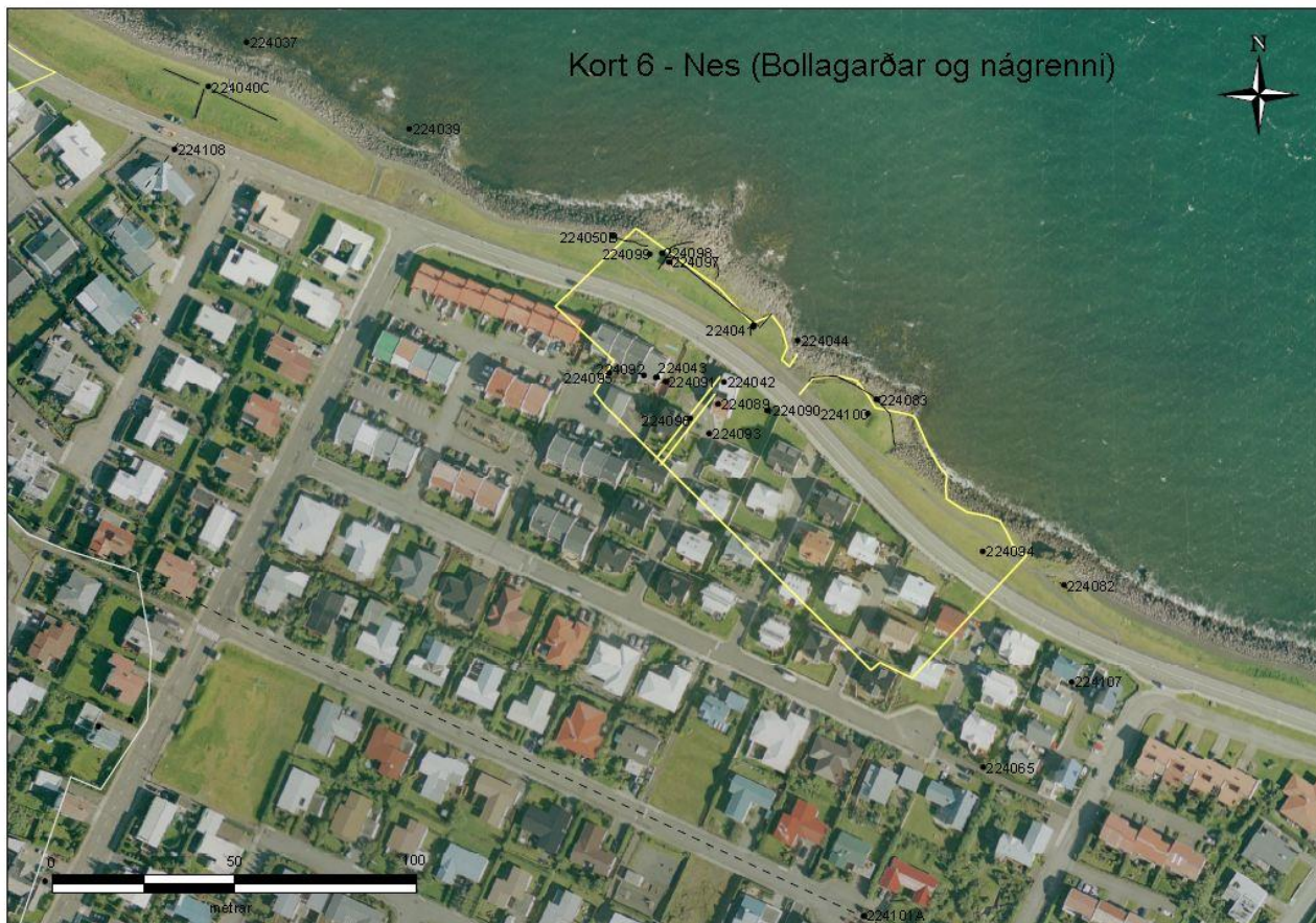
Mynd 3: Forleifar á deiliskipulagsreit

Engin friðlýst svæði eru á skipulagssvæðinu en unnin hefur verið fornleifaskráning á Seltjarnarnesi 2006 (FS 305-05221). Þar kemur fram að ýmsar fornleifar eru á skipulagssvæðinu svo sem merki um bústaði, lendingu, gönguleið, kálgarða og frásögn um hjall. Allt er þetta að mestu leyti horfið undir götur, hús eða tún.