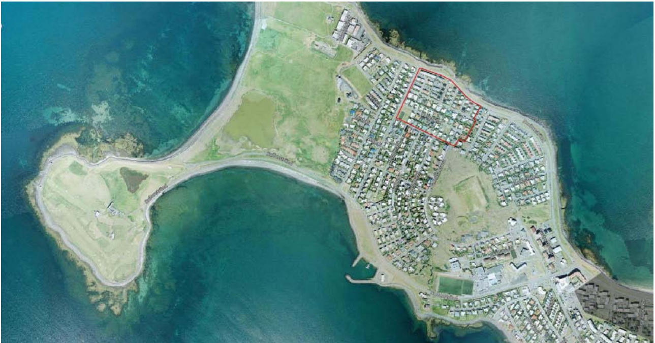
Mynd 1: Mörk deiliskipulagssvæðis afmörkuð með rauðu