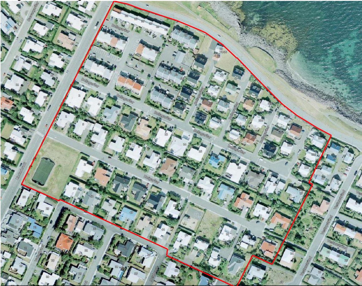
Mynd 3: Deiliskipulagssvæði afmarkað með rauðu

Skipulagssvæðið afmarkast af Lindarbraut, Melabraut og Norðurströnd, en að öðru leiti lóðamörkum húsa við Bollagarða, Hofgarða og Melabraut 40-.54 . Stærð svæðið er um 8.5 hektarar.