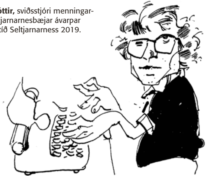
Skopteikning eftir Pilkington